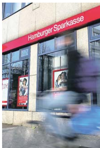
Nicht fehlerhaft beraten: Die Karlsruher Richter sprachen indirekt die Hamburger Sparkasse frei.

Viele wählten deshalb einen anderen Weg: Sie verklagten die Hamburger Sparkasse, die ihnen die Papiere verkauft hatte. Die Bank habe ihre Beratungs- und Aufklärungspflichten verletzt. Deshalb müsse sie das Geschäft rückgängig machen. Die Hürden hierfür liegen nach dem Urteil des BGH ziemlich hoch. Im Rahmen der Beratung müsse die Bank zunächst nur auf das allgemeine Risiko hinweisen, dass bei einer Anleihe ein Totalverlust drohen kann. Anders verhält es sich hingegen mit dem „konkreten Emittentenrisiko“ – also hier der Gefahr, dass Lehman Brothers selbst Pleite gehen könnte.